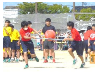
1学年種目「ボール運び」