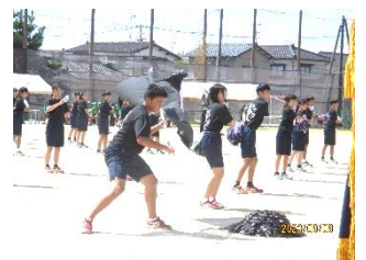
黒連合パフォーマンス