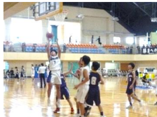
【男子バスケットボール部】