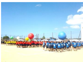
団体種目「大玉送り」