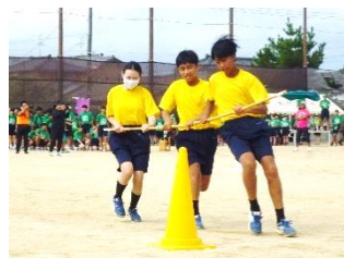
2学年種目「台風の目」