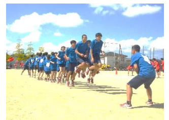
3学年種目「大縄跳び」