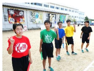
連合ごとのTシャツで