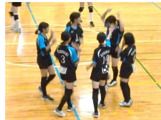
【女子バレーボール部】