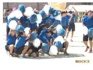
青連合パフォーマンス