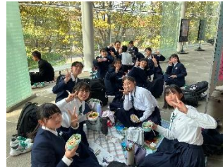
ハワイエでの昼食