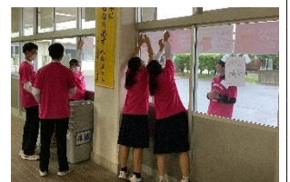
ピンクシャツデー準備中の生徒会本部の皆さん

11月1日の集会では、その取組の報告がありましたが、生徒たちが自らの力で、自分たちの学校をより良くしていこうと活動している姿は、本当に素晴らしいと感じます。当日はオープンスクールでもあり、たくさんの保護者の皆さんに参観していただきました。ありがとうございました。