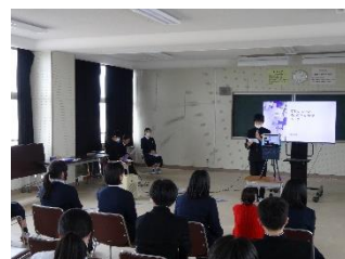
視聴覚室からの配信