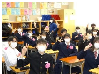
お花をつけてワクワク