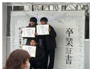
感謝プロジェクト「卒業感じるフォトスポット」生徒会本部