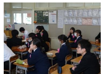
真剣にみえています